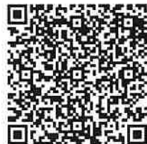
仲間と楽しくスキルW-up ①〜④