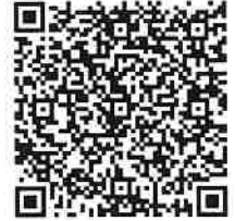
リズムで行う剣道 リズムありVersion⑫〜⑳